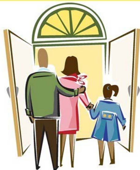
Accueil des nouveaux paroissiens

A 16h30 messe présidée par Monseigneur DELANOY en la cathédrale pour la fête de Saint Denis (p.4)